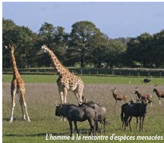
L'homme à la rencontre d'espèces menacées

Sur le papier, le dessein de cette « école de la nature » est séduisant : sensibiliser la jeune génération à la biodiversité, dans un écrin de verdure, au cœur d'un parc animalier et botanique de 40 ha. Sur site, YPREMA l'atteste, les promesses sont tenues et font de cet espace un concept unique en France, dans une perspective de développement durable.