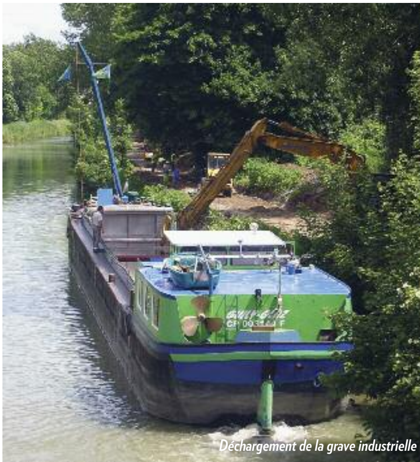
Déchargement de la grave industrielle

L'envolée du prix des carburants conduit les entreprises de travaux publics à modifier leur comportement pour le transport des matériaux. Le transport en péniche, hier décrié et jugé obsolète et lent, séduit de plus en plus les acteurs des travaux publics, présents sur des chantiers en bordure de la Marne.