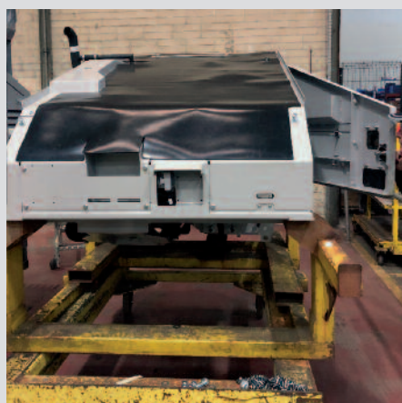
Moteur d'entraînement du crible