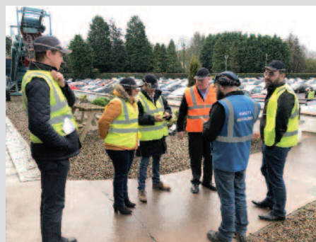
Équipes Terex Finlay et YPREMA