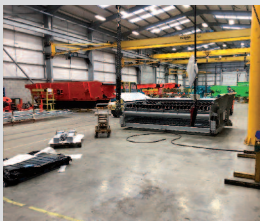
Barraudage du crible