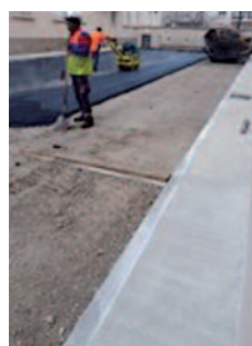
Mise en œuvre des enrobés sur la Grave béton concassé 0/31.5

Une fois de plus la proximité du site YPREMA Trappes (78) a été déterminante.