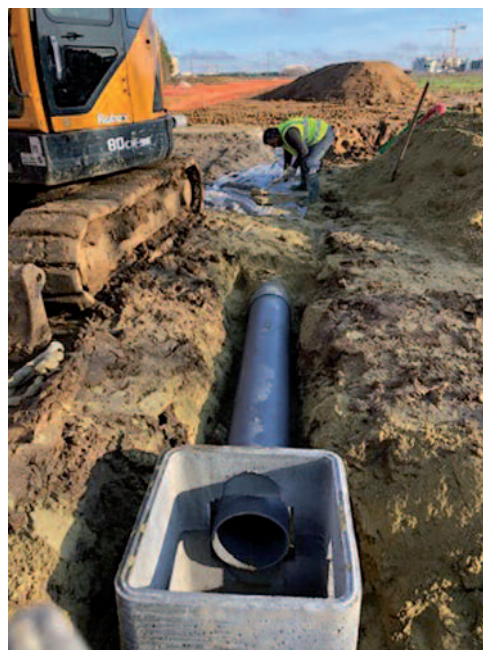
Enrobage de la canalisation en Sablon

SETP a décidé de mettre en place du sablon en enrobage canalisation, recouvert ensuite de Grave Concassée Industrielle 0/31.5, sur 20 cm en tant que couche de forme. La Grave de Béton Concassée 0/31.5 a été utilisée dans la même proportion pour la couche de fondation et de structure du local technique.