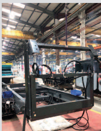
Châssis du Terex Finlay 595