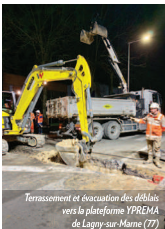
Terrassement et évacuation des déblais vers la plateforme YPREMA de Lagny-sur-Marne (77)

Dans la zone industrielle de Torcy (77), le centre RATP s'équipe en bus fonctionnant au gaz naturel véhicules. Pour cela, les équipes de la société Spac effectuent la pose d'un réseau gaz diamètre 100 mm sur 400 m linéaires en zone urbaine.