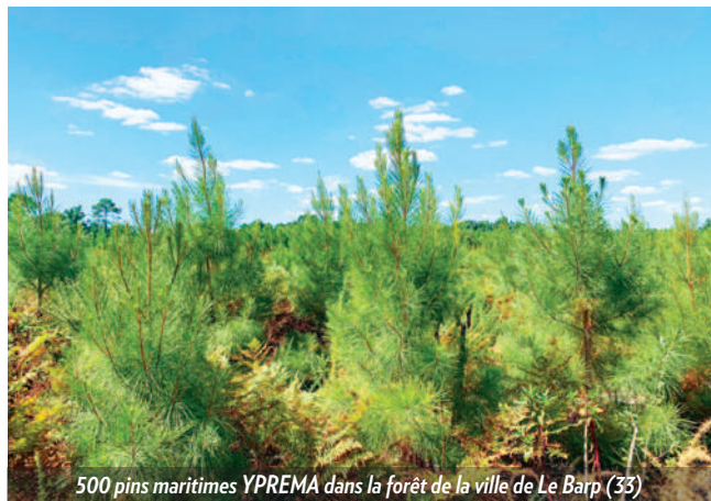
500 pins maritimes YPREMA dans la forêt de la ville de Le Barp (33)

YPREMA est aujourd'hui associée à Bergerat Monnoyeur dans le cadre d'un programme de reboisement. 500 plants de pins maritimes ont été plantés au mois de septembre en Gironde dans la ville de Le Barp (33). C'est dans le cadre d'un contrat de location longue durée de machines signé par YPREMA que le concessionnaire français exclusif de Caterpillar propose une participation à la reforestation de la forêt Girondine avec les pépinières Naudet. Les 2 entreprises partenaires, animées par l'envie de contribuer à leur échelle à limiter l'impact de leurs activités ont ainsi joint l'utile au développement durable !