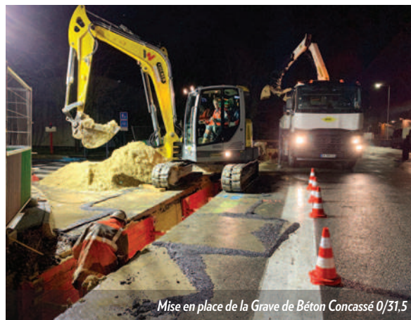
Mise en place de la Grave de Béton Concassé 0/31,5

C e réseau sera prochainement exploité par GRTgaz pour acheminer le carburant en vue d'assurer l'alimentation des bus. YPREMA accompagne ce chantier durant ces 9 mois de réalisation. Afin de limiter l'impact sur la vie de la zone industrielle, une grande partie des opérations a été effectuée de nuit.