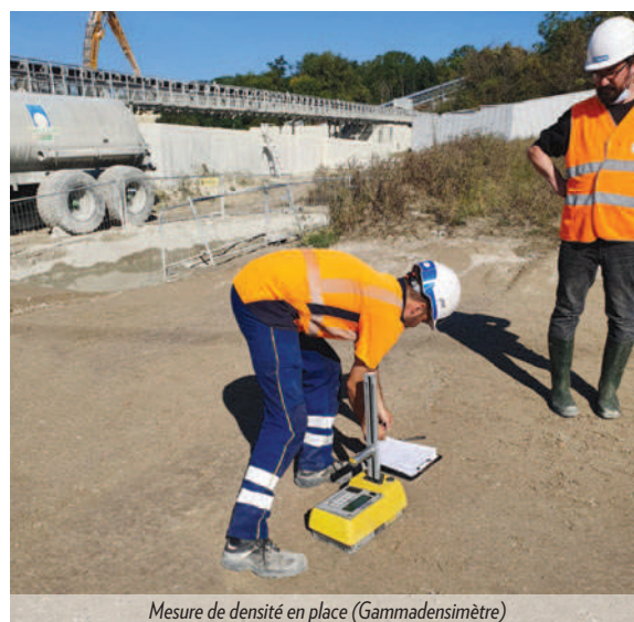
Mesure de densité en place (Gammadensimètre)

Nous avons hâte d'accompagner Guintoli sur les futurs challenges !