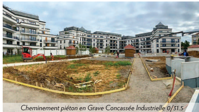
Cheminement piéton en Grave Concassée Industrielle 0/31.5

YPREMA permet aux paysagistes de promouvoir des matériaux recyclés.