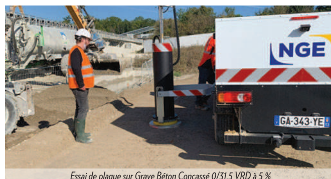
Essai de plaque sur Grave Béton Concassé 0/31.5 VRD à 5 %