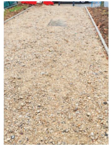
Grave Béton Concassé 0/31.5 après mise en œuvre