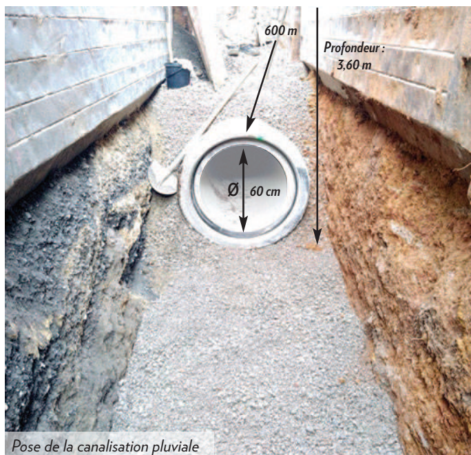
Pose de la canalisation pluviale

Urbaine de Travaux a bénéficié de la proximité d'YPREMA (21 minutes) qui a mis en œuvre un système de double fret innovant pour minimiser l'impact environnemental du transport des matériaux. Ce système, intégré de manière harmonieuse dans le processus, a permis de transporter du gravillon depuis le site YPREMA de Massy (91) vers le chantier tout en évacuant efficacement la terre extraite.