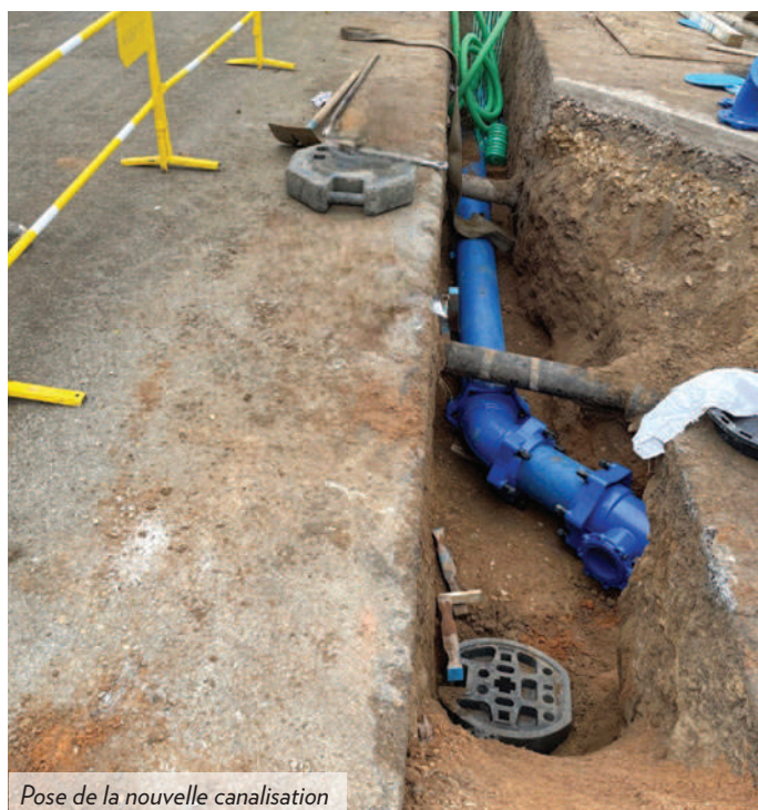
Pose de la nouvelle canalisation

Un aspect de notre collaboration avec AXEO TP est l'adoption du double fret . Cette méthode logistique consiste à livrer nos matériaux recyclés sur le chantier et, en retour, à transporter les terres excavées vers notre site de Gennevilliers (92). Cette approche réduit considérablement l'empreinte carbone du projet, soulignant notre engagement commun envers des pratiques de construction plus respectueuses de l'environnement.