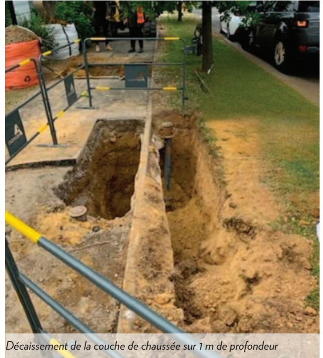
Décaissement de la couche de chaussée sur 1 m de profondeur