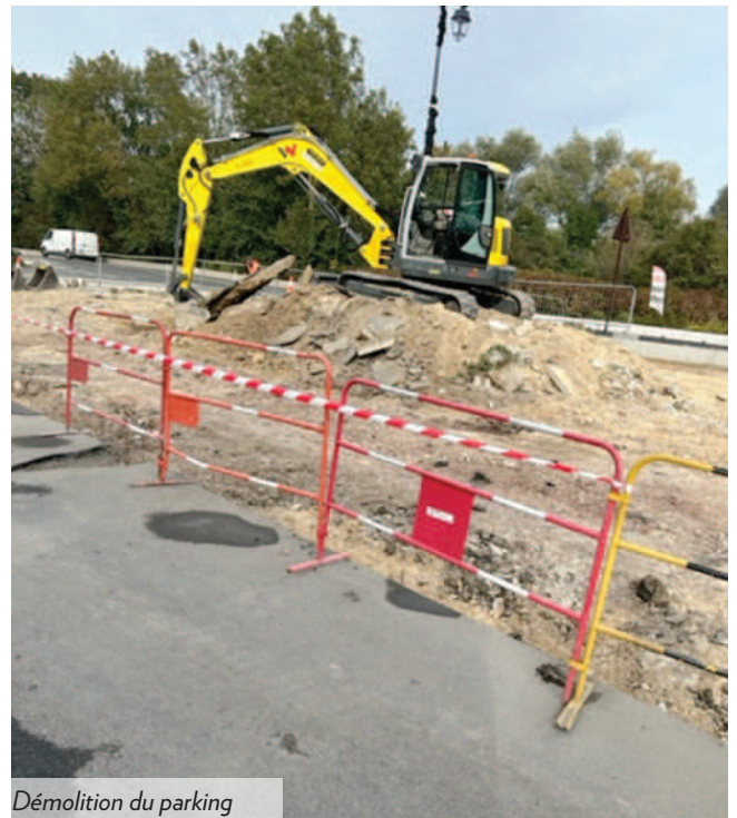
Démolition du parking

Grâce à notre implantation à proximité des chantiers, YPREMA assure la qualité de ses produits entrants, avec une attention particulière portée à la satisfaction de nos clients.